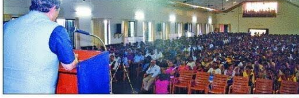
ಉಪನ್ಯಾಸ ಕಾರ್ಯಕ್ರಮದಲ್ಲಿ ನಿವೃತ್ತ ಲೋಕಾಯುಕ್ತ ಎನ್.ಸಂತೋಷ್ ಹೆಗ್ಗಡಿ ವಿಷಾದಿಸಿದರು.

ರಾಷ್ಟ್ರದ ಹಿತಾಸಕ್ತಿ ಕಾಪಾಡಲು ನಮ್ಮ ಹಿರಿಯರು ಸಂವಿಧಾನದಲ್ಲಿ ಶಾಸಕಾಂಗ, ಕಾರ್ಯಾಂಗ, ನ್ಯಾಯಾಂಗ ವ್ಯವಸ್ಥೆ